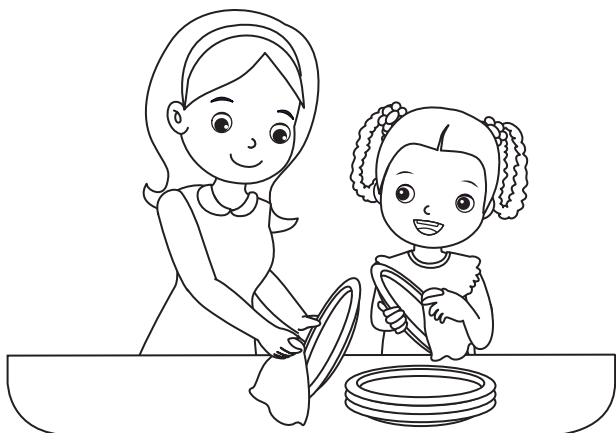
ช่วยแม่เช็ดจาน