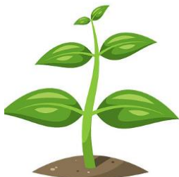
ธรรมชาติ