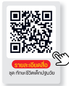
รายละเอียดสื่อ ชุด ทักษะชีวิตเด็กปฐมวัย

กิจกรรมส่งเสริมทักษะชีวิตให้เด็กมีความรู้ ความเข้าใจด้านการช่วยเหลือ และดูแลตนเอง การปฏิบัติตนเมื่ออยู่ร่วมกับผู้อื่น เห็นคุณค่าของสิ่งรอบตัว ใช้สอยอย่างประหยัด พอดี ตามหลักเศรษฐกิจพอเพียง