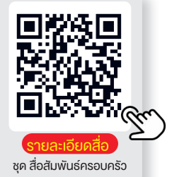
รายละเอียดชุด สื่อสัมพันธ์ครอบครัว