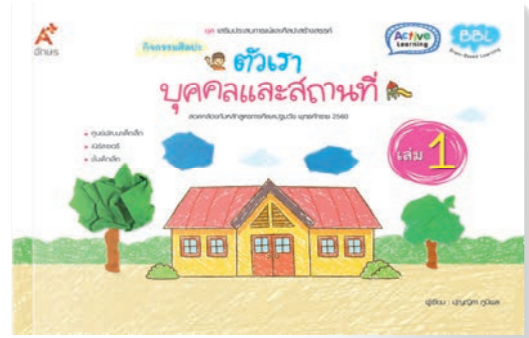
กิจกรรมศิลปะ ตัวเรา บุคคลและสถานที่ (เล่ม 1)

ส่งเสริมพัฒนาการด้านศิลปะ ความคิดสร้างสรรค์ จินตนาการ วาดรูป ระบายสี กิจกรรมเป็นแบบ Active Learning และสอดคล้องกับการเรียนรู้ตามหลัก BBL มีเทคนิคการสร้างบรรยากาศที่เหมาะสมต่อการเรียนรู้