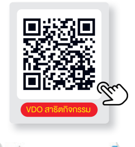
VDO สารคดีกิจกรรม