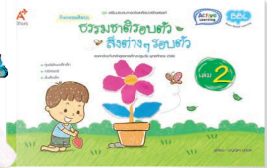
กิจกรรมศิลปะ ธรรมชาติรอบตัว สิ่งต่าง ๆ รอบตัว (เล่ม 2)