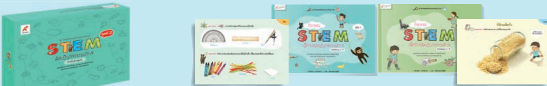
STEM ปฐมวัย ชุดที่ 2 คิดเป็นกระบวนการ (1 ชุด มี 2 เล่ม)