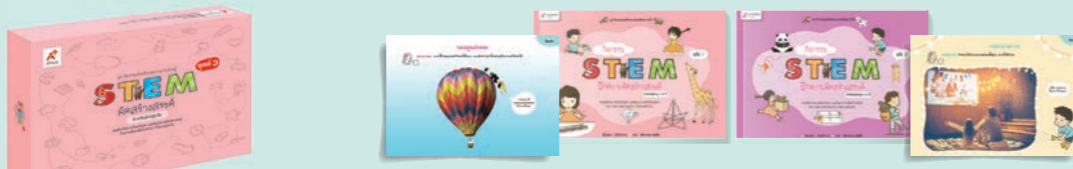
STEM ปฐมวัย ชุดที่ 3 คิดสร้างสรรค์ (1 ชุด มี 2 เล่ม)