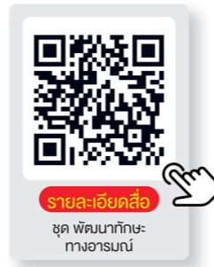
รายละเอียดสื่อ ชุด พัฒนาทักษะทางอารมณ์