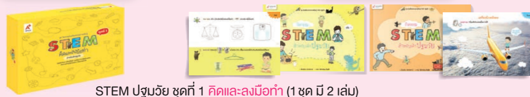
STEM ปฐมวัย ชุดที่ 1 คัดและลงมือทำ (1 ชุด มี 2 เล่ม)