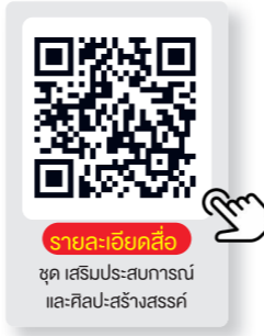
รายละเอียดชุด เสริมประสบการณ์และศิลปะสร้างสรรค์